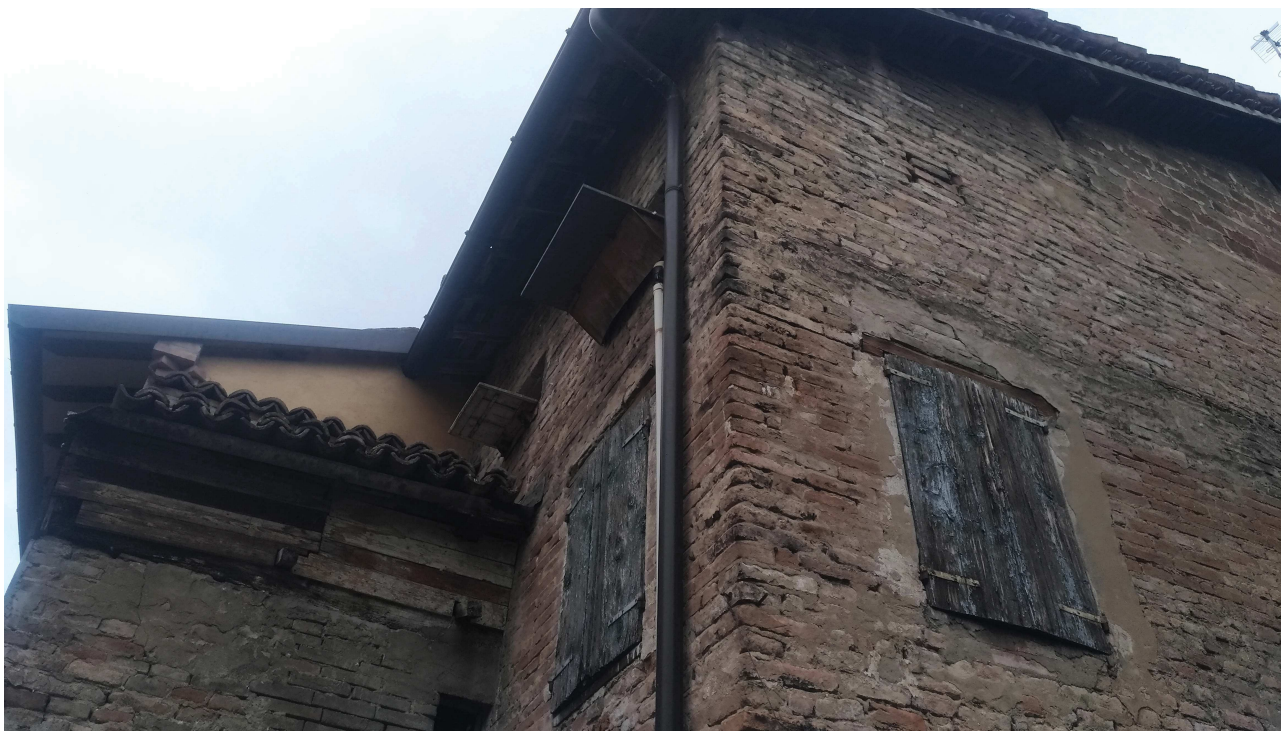
Foto 11: volume del piano primo e sottotetto con ripostiglio adiacente