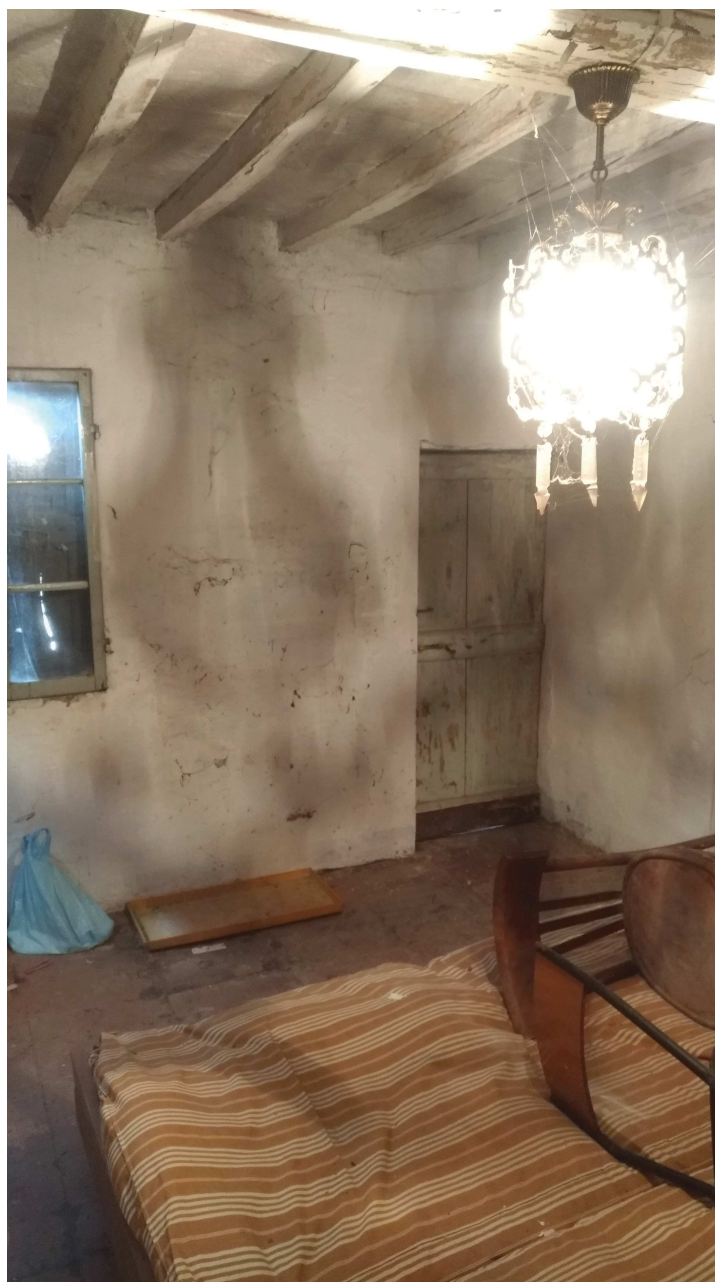
Foto 16: primo piano con porta di accesso locale ripostiglio ( vedi foto n°10)