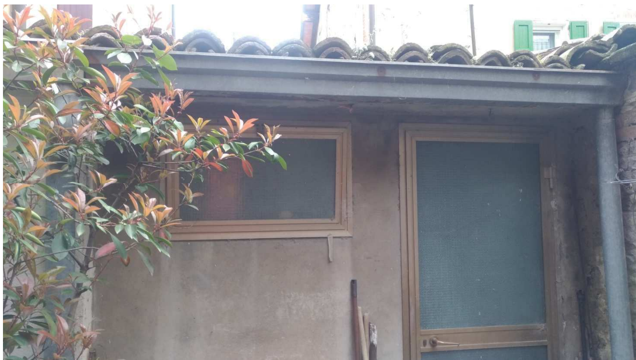
Foto 12: piano terra, bassoservizio con wc esterno su cortile esterno