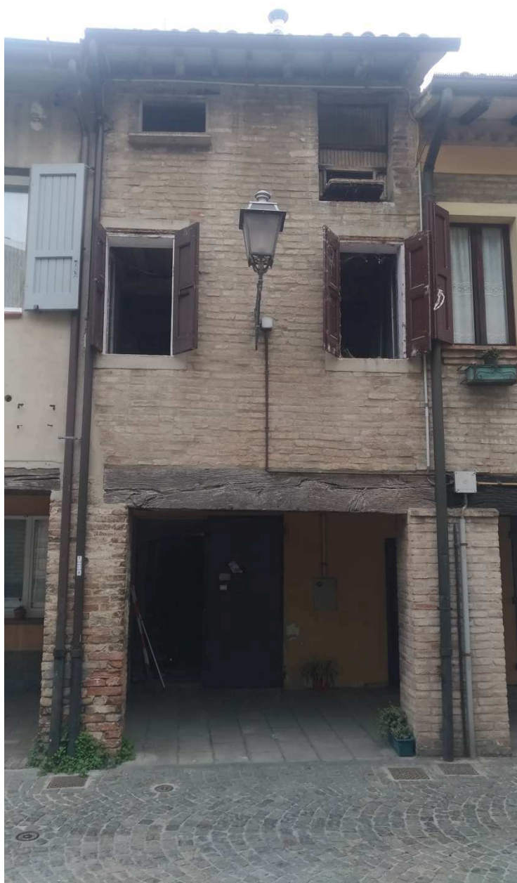
Foto 2: porzione di facciata relativa all'unità immobiliare in oggetto