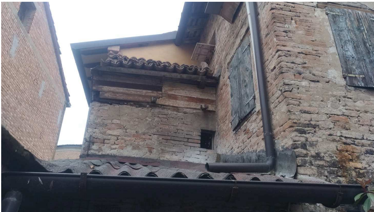
Foto 10: copertura del locale cantina da cui si esce sul cortile, in evidenza volume del ripostiglio al piano superiore