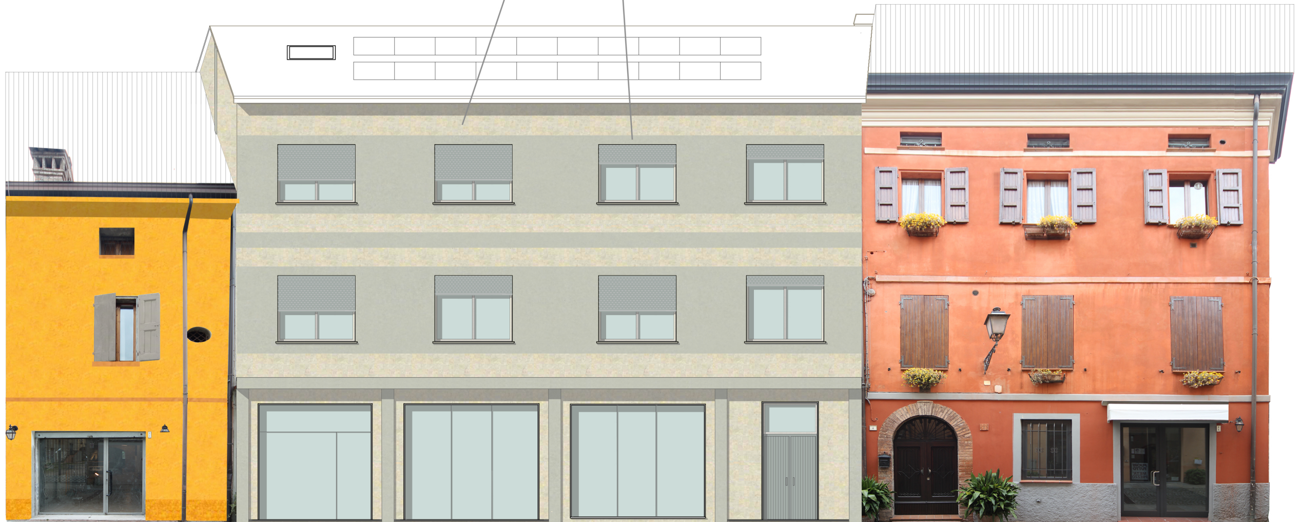
colorazione prevista dal Piano Colore