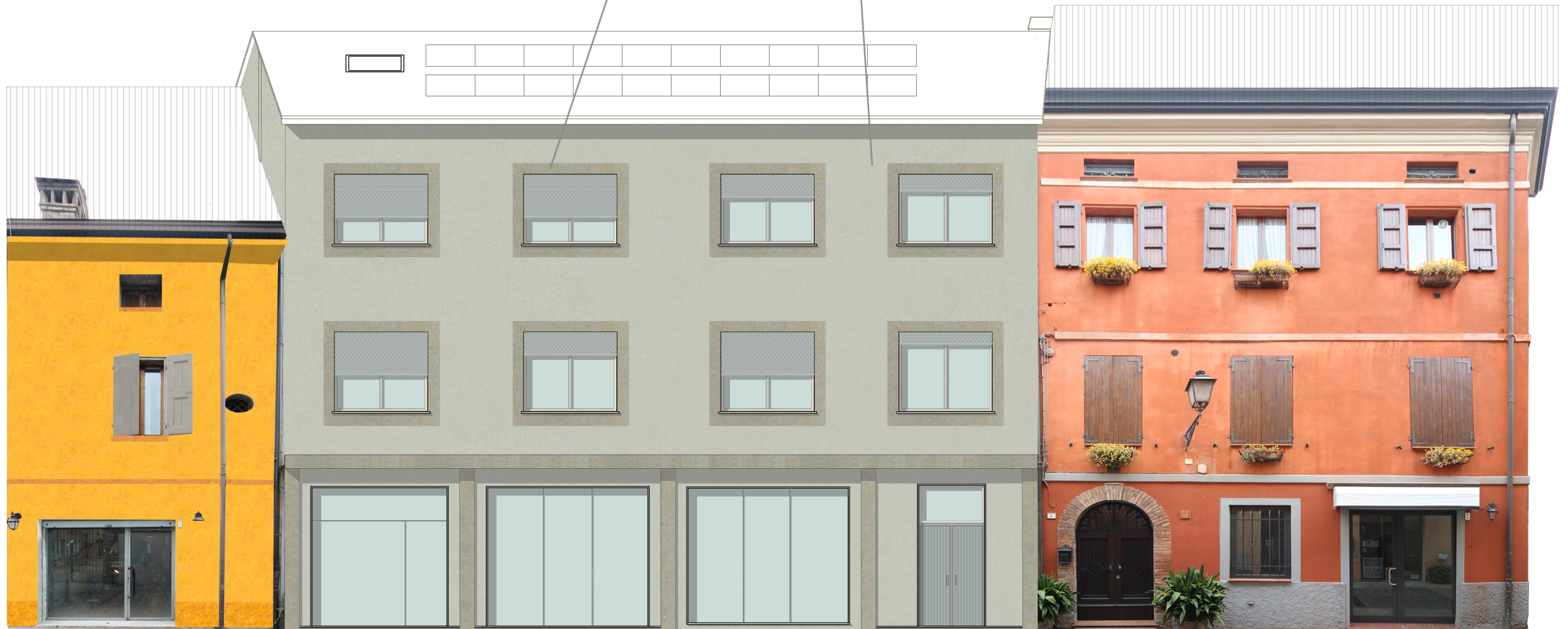
colorazione prevista dal Piano Colore