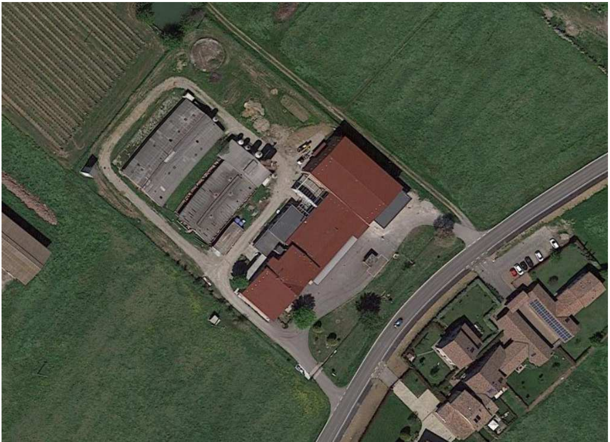
Latteria Soc. La Rinascente – San Bartolomeo (RE)