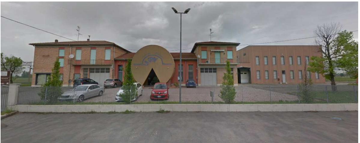
Latteria la Grande – Castelnovo di Sotto (RE)