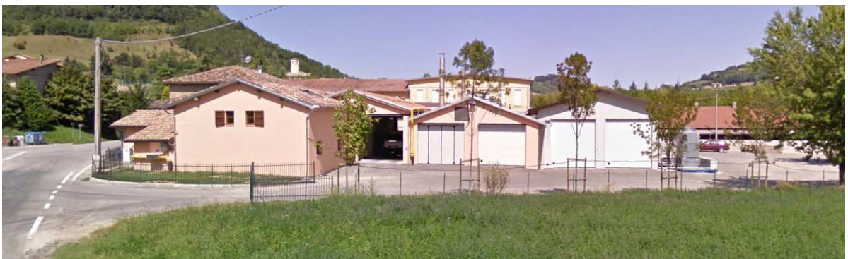
Latteria Sociale del Fornacione – Loc. Felina Castelnovo né Monti (RE)