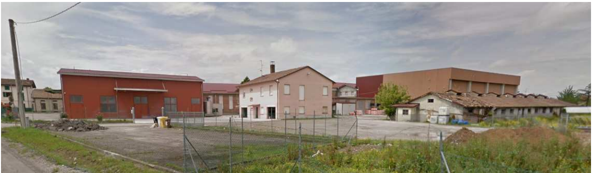
Latteria Soc. Centro di Rubbianino – Reggio Emilia