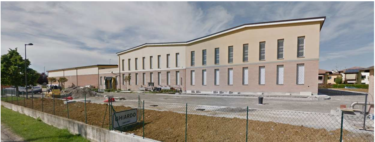
Latteria Soc. Centro Ghiardo – Bibbiano (RE)