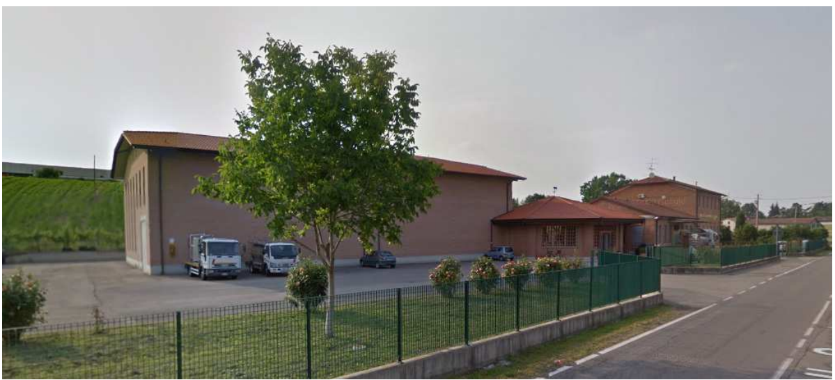
Caseificio Il Boiardo – Pratissolo di Scandiano (RE)