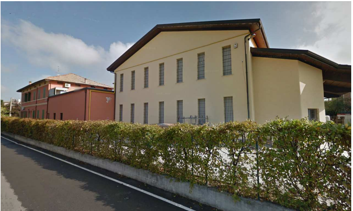
Latteria Sociale Bagnolo in Piano – Bagnolo in Piano (RE)