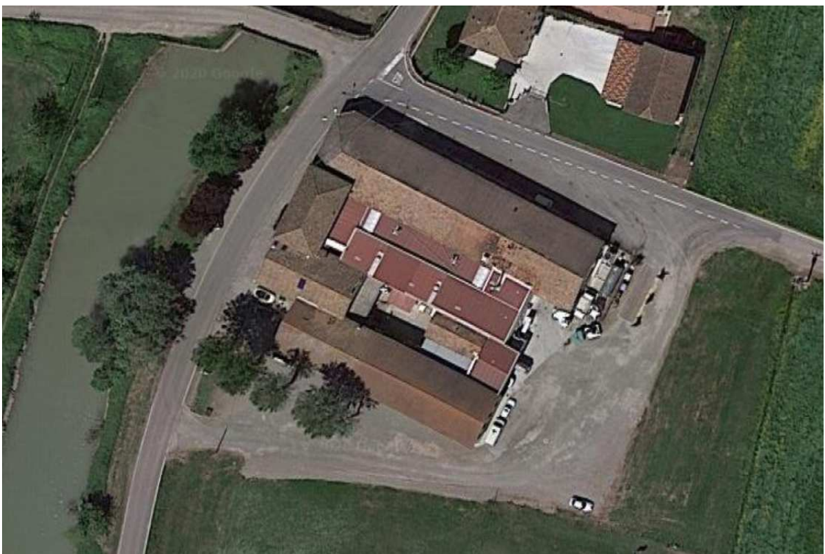
Latteria Villa Curta – Reggio Emilia