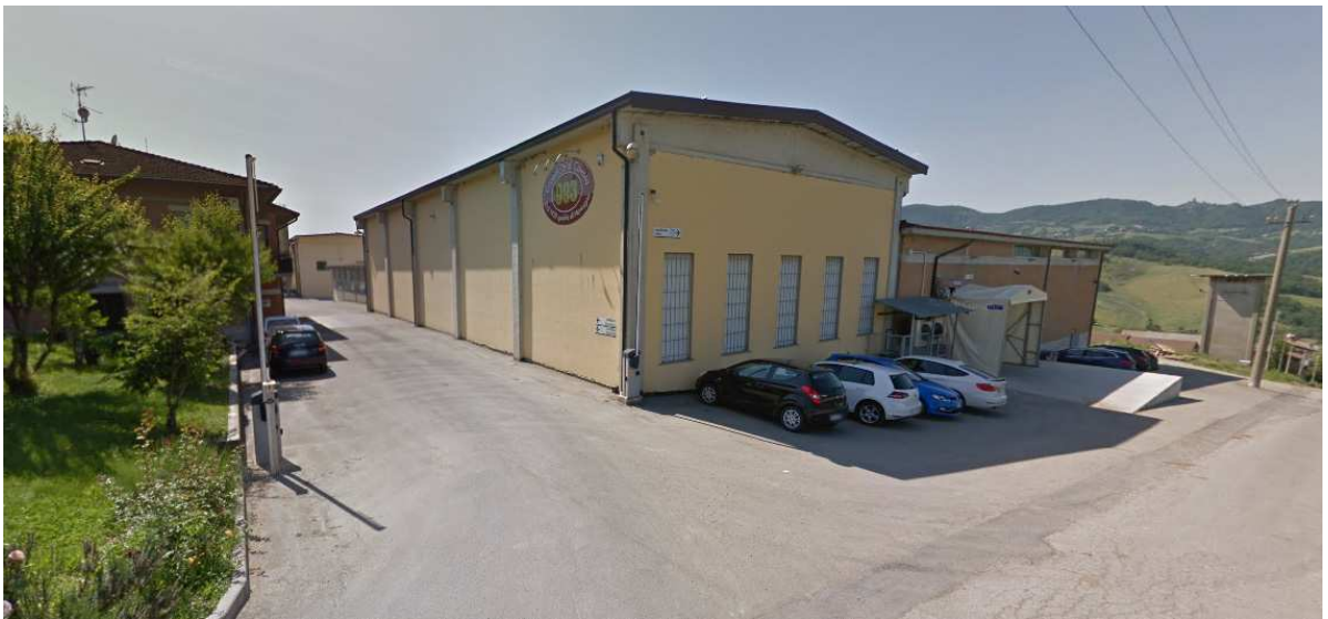
Caseificio di Cavola – Cavola di Toano (RE)