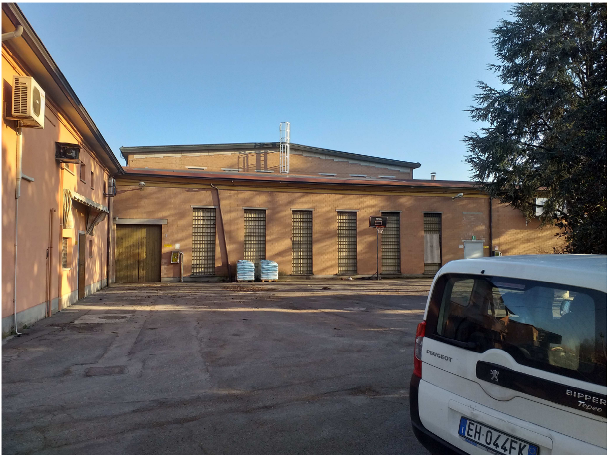
I magazzini della Nuova Latteria Fontana – Rubiera (RE)