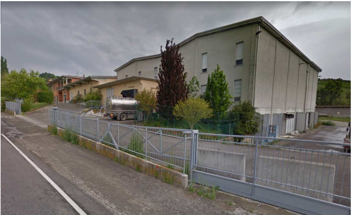
Caseificio di Neviano degli Arduini – Neviano degli Arduini (PR)