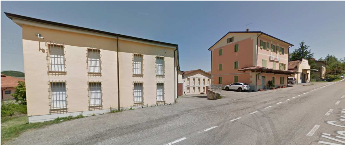
Latteria Sociale Cagnola – Castelnovo né Monti (RE)