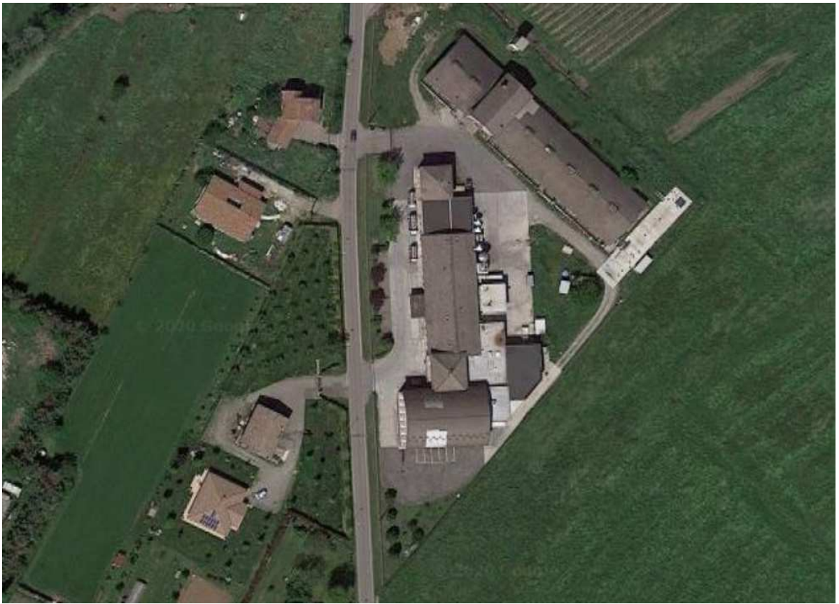
Latteria Soc. Nuova 2000 – Cavriago (RE)