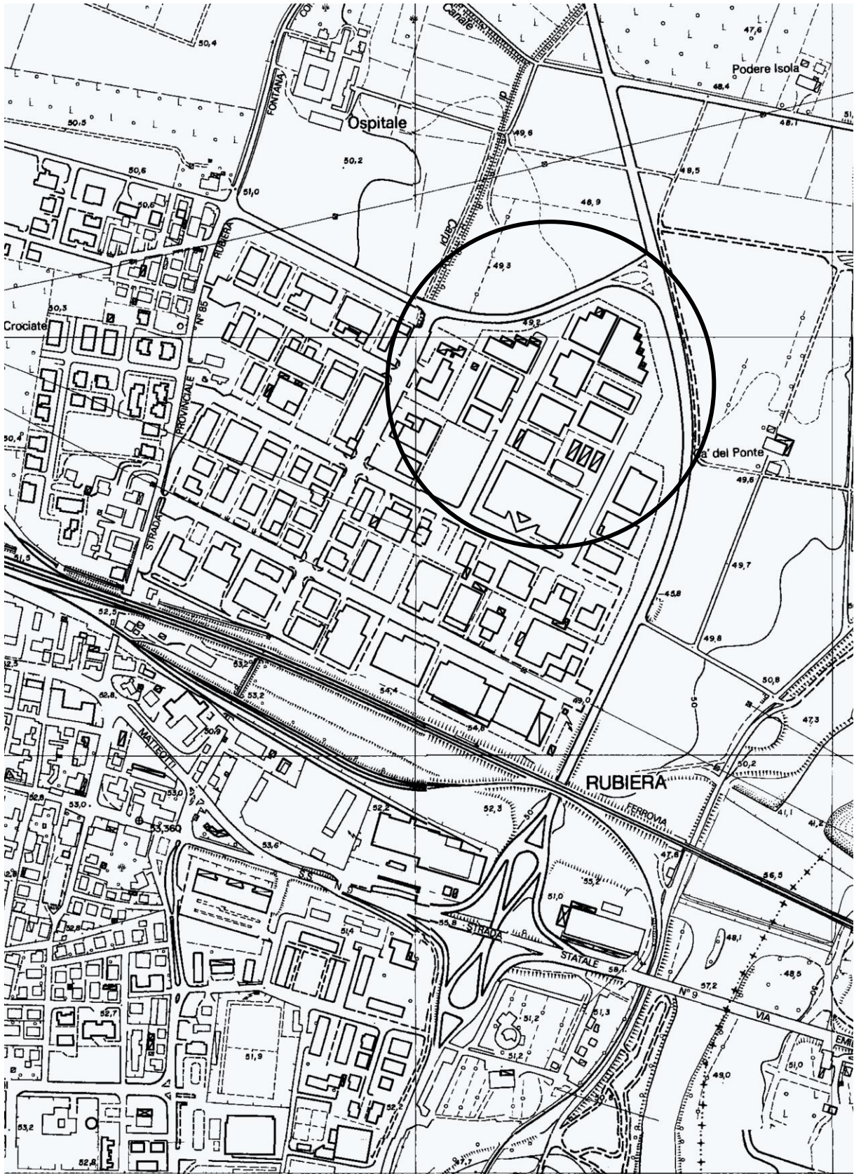
FOTO AEREA VILLAGGIO ARTIGIANO