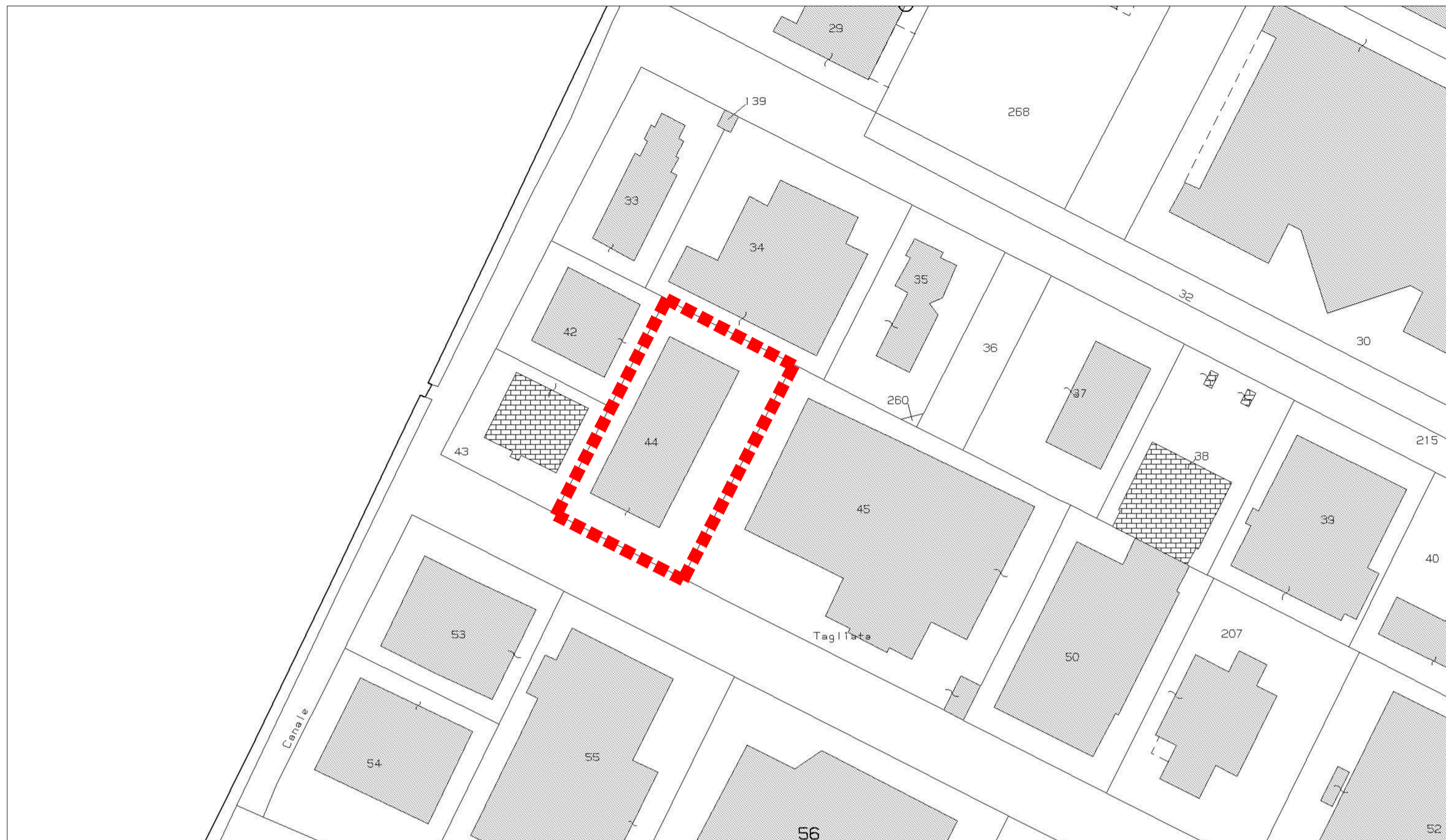
ESTRATTO DI MAPPA - COMUNE DI RUBIERA - FG 21, MP 44 N SCALA 1:1000