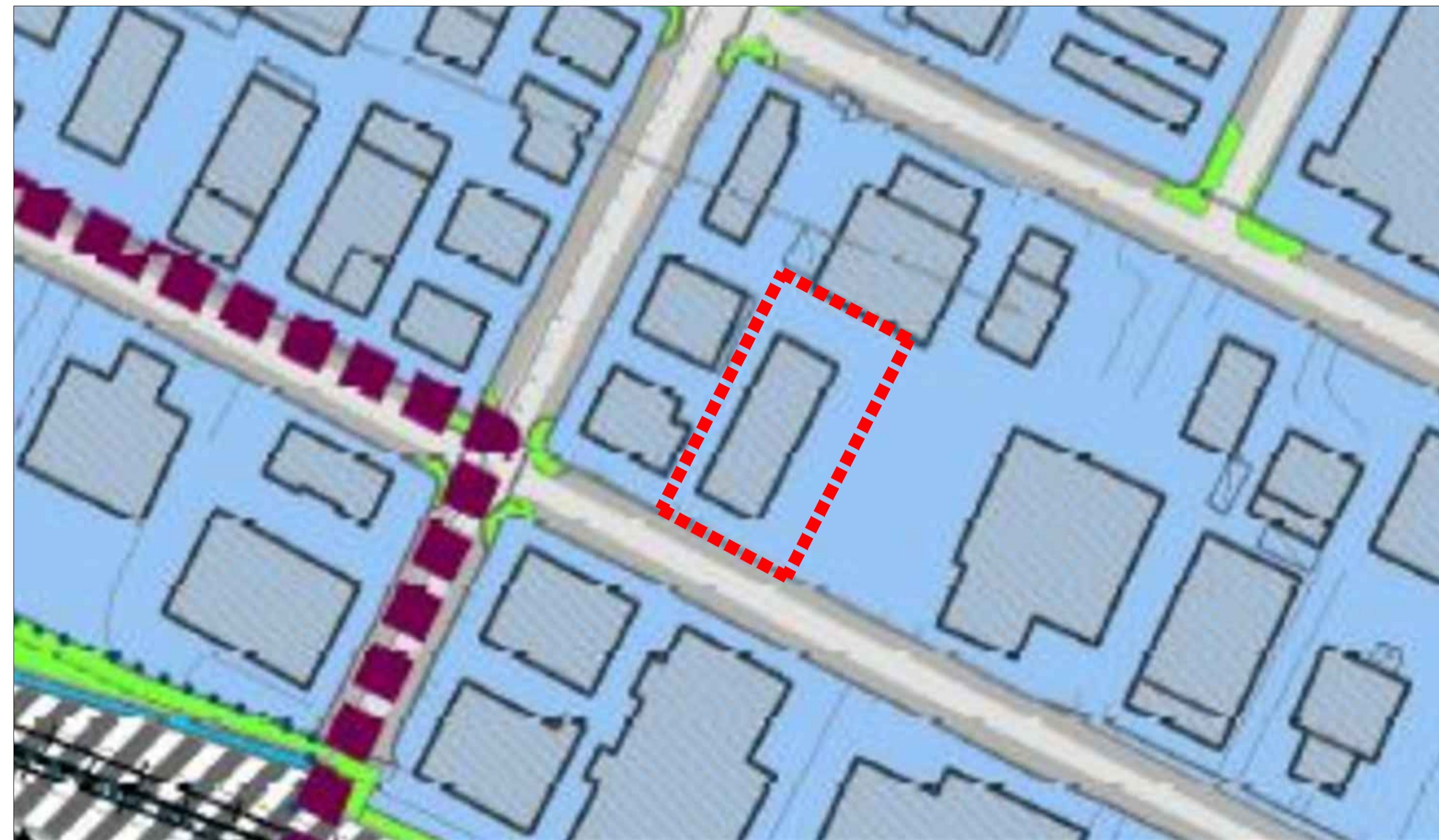
ESTRATTO DEL REGOLAMENTO URBANISTICO EDILIZIO (RUE) - COMUNE DI RUBIERA N SCALA 1:1000