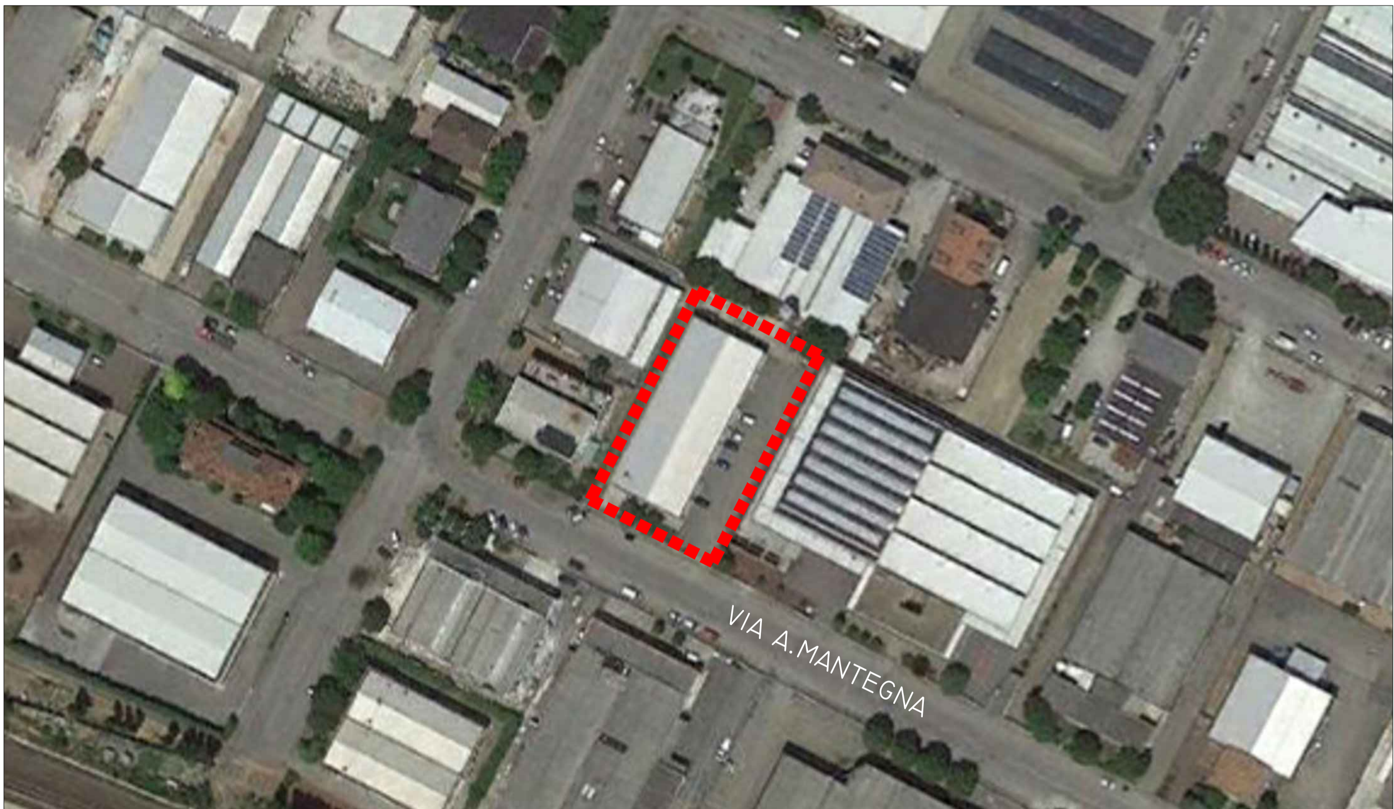
ORTOFOTO N SCALA 1:1000