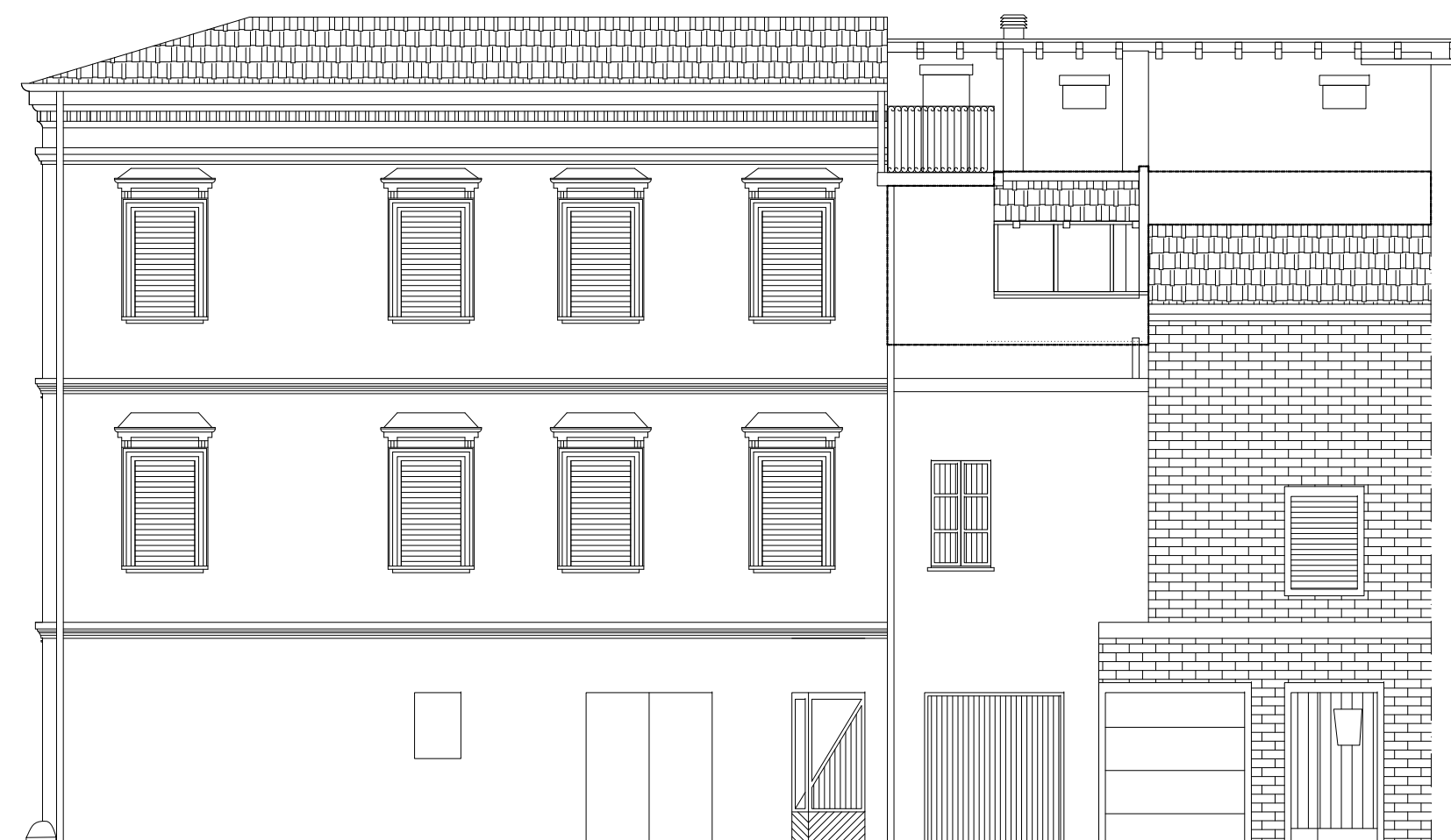
PROSPETTO OVEST PROGETTO