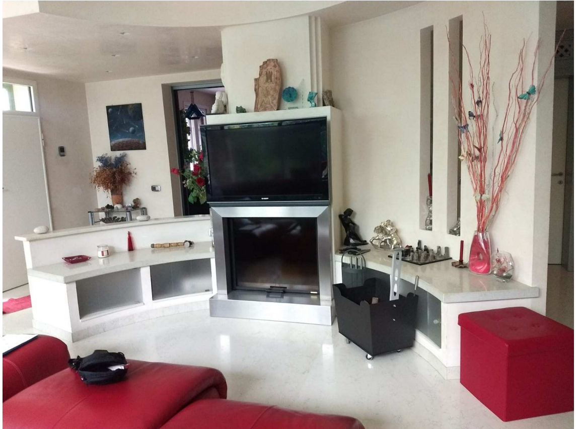
Foto 9 PARTICOLARE CAMINO ALLOGGIO NORD PIANO TERRA