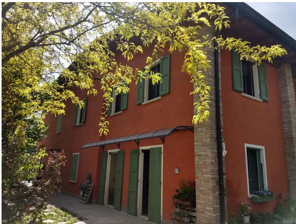
Foto 5 PROSPETTO NORD-EST CON PENSILINA IN ACCIAIO E VETRO