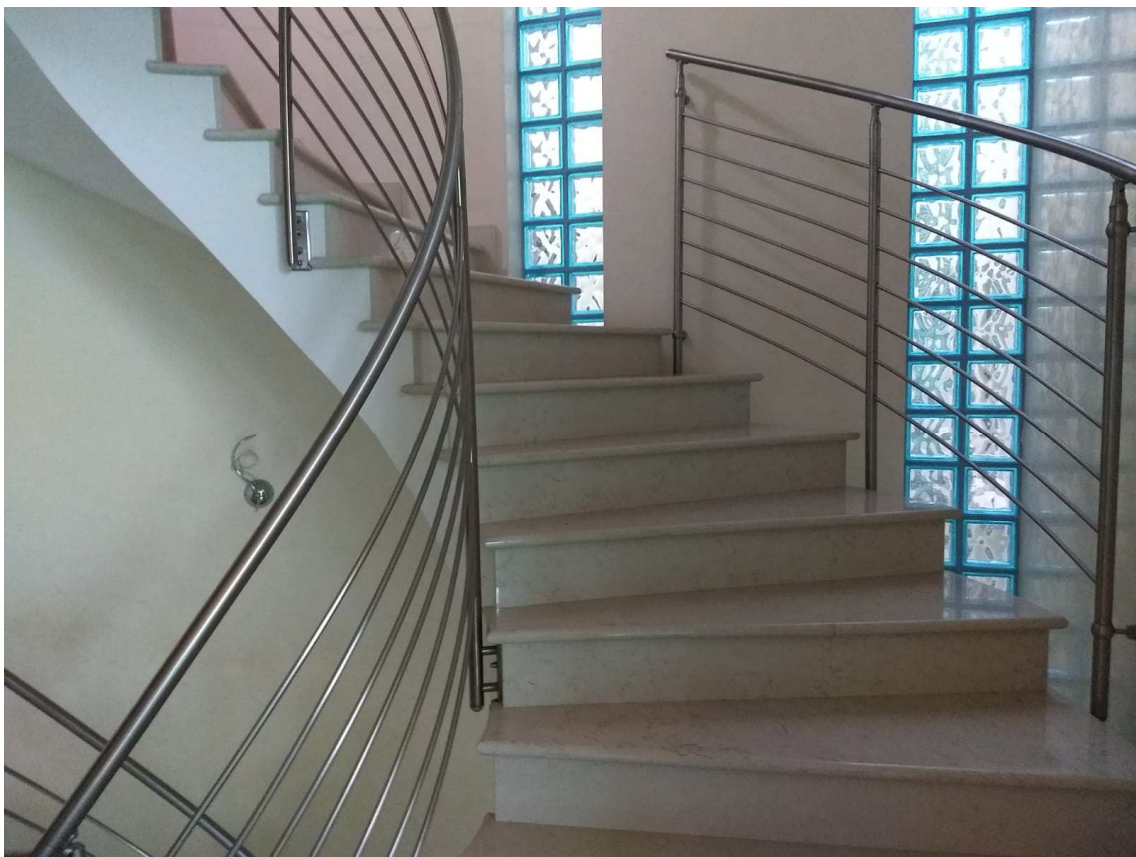
Foto 12 PARTICOLARE VANO SCALA ALLOGGIO SUD PIANO TERRA