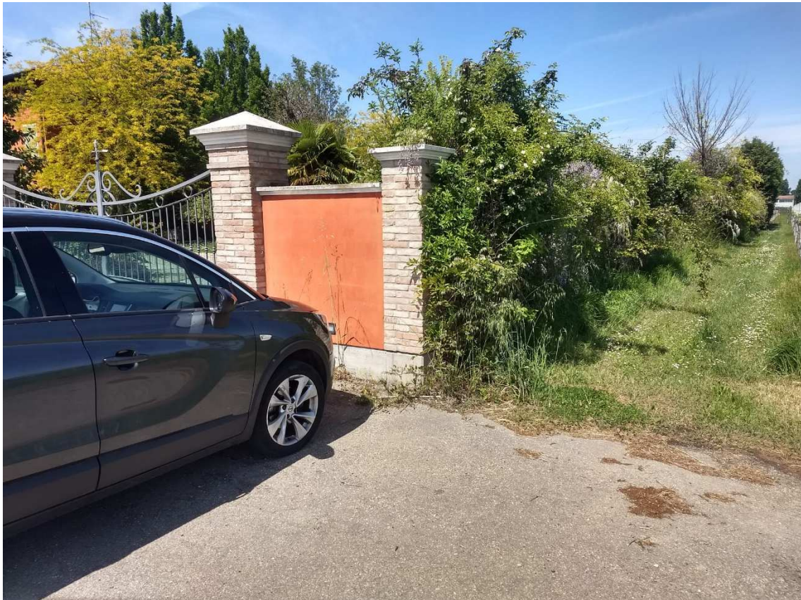
Foto 3 ZONA INGRESSO - PARTICOLARE POSTO AUTO ORTOGONALE AL CORSO STRADALE