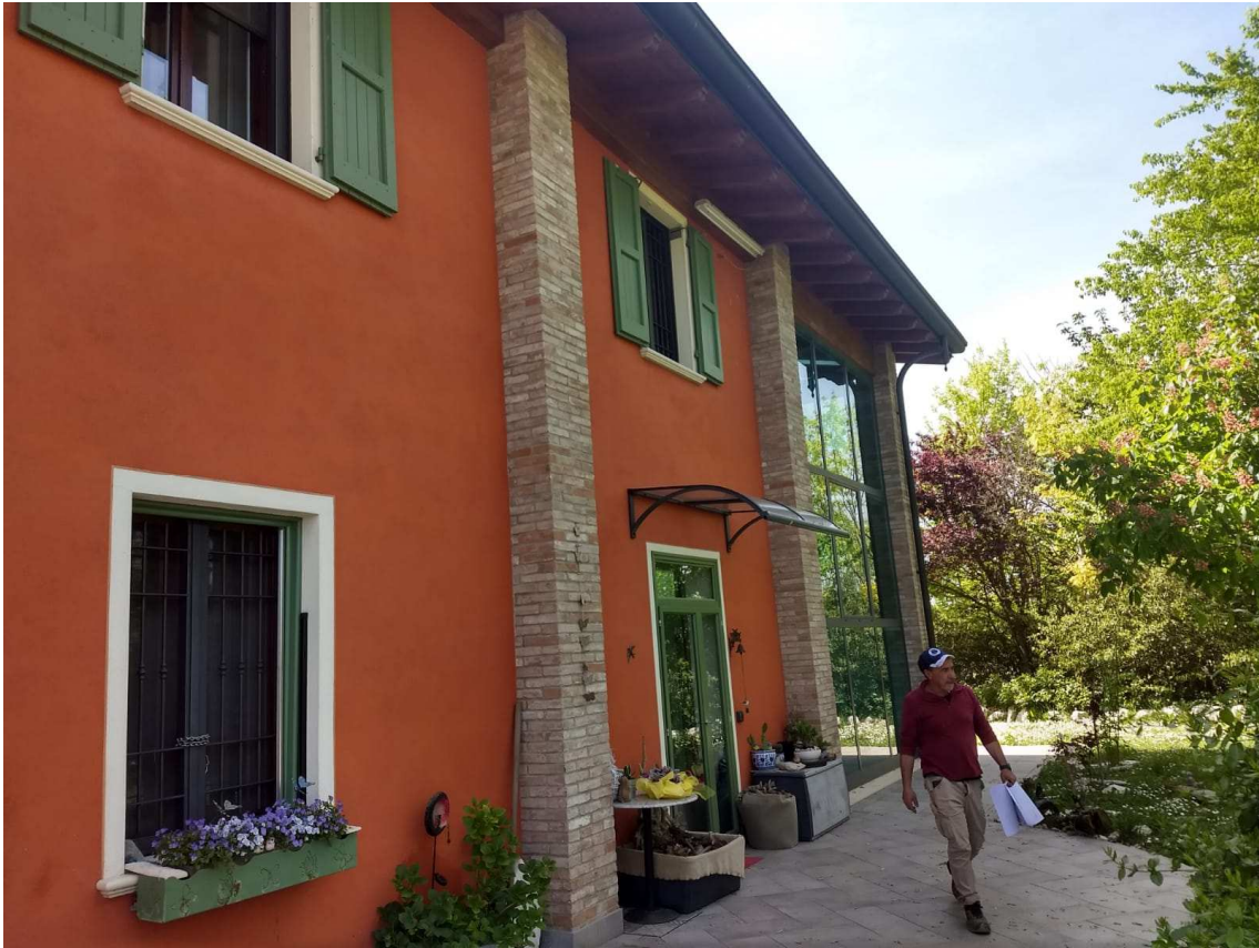
Foto 7 PROSPETTO NORD CON PENSILINA IN ACCIAIO E VETRO