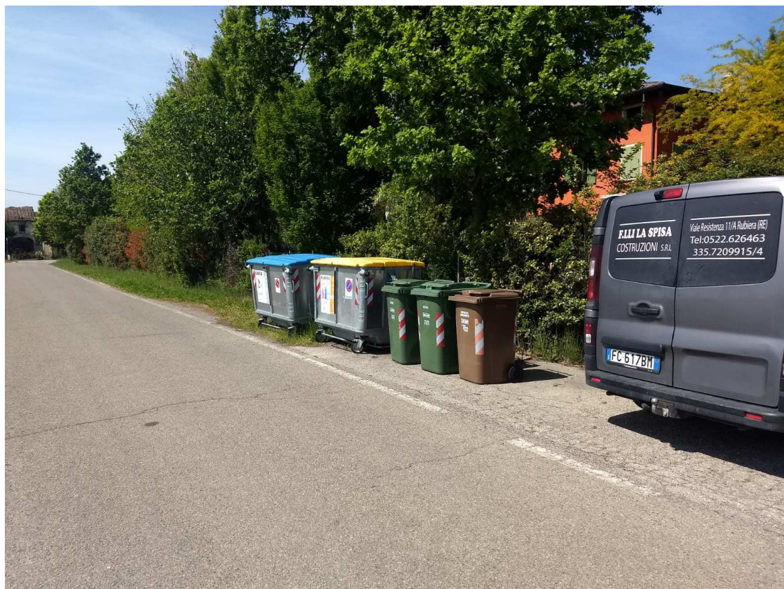
Foto 4 ZONA INGRESSO – PARTICOLARE AREA DESTINATA AI CASSONETTI DELLA NETTEZZA URBANA