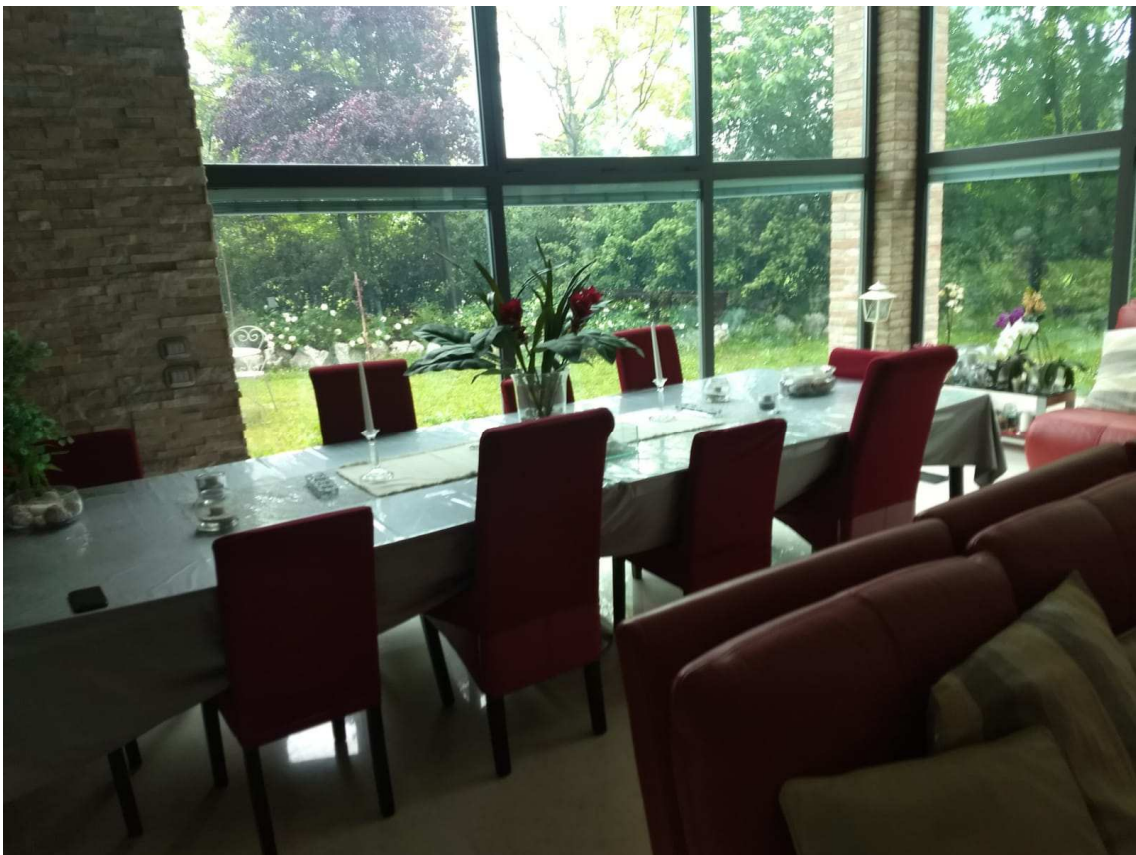
Foto 10 ZONA PRANZO ALLOGGIO NORD PIANO TERRA