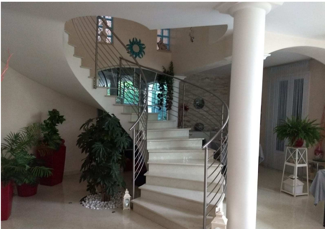
Foto 8 SCALA ALLOGGIO NORD PIANO TERRA