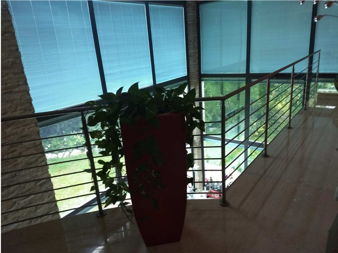
Foto 11 PARTICOLARE SOPPALCO ALLOGGIO NORD PIANO PRIMO